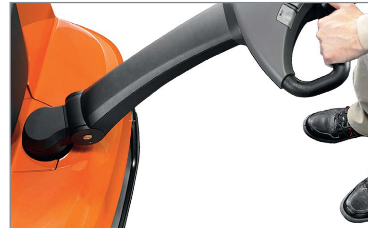
Рукоятка оптимизирована для безопасной работы и защищает ноги оператора от наезда.