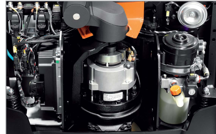
Управление по CAN-шине обеспечивает мгновенный отклик и точный контроль.