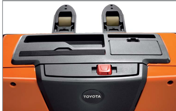
Программируемый таймер автоотключения при простое от 1 минуты до 4 часов.